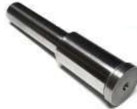
Postes con hombro