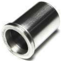
Bujes con hombro