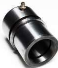
Bujes con hombro