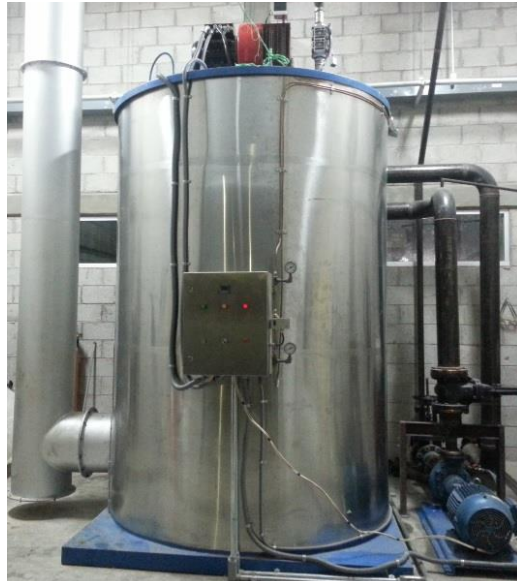
CALENTADOR CON CAP 8,000,000 DE BTU/HR