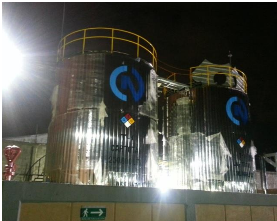
TANQUES CAP. 250,000 LTS PARA ASFALTO