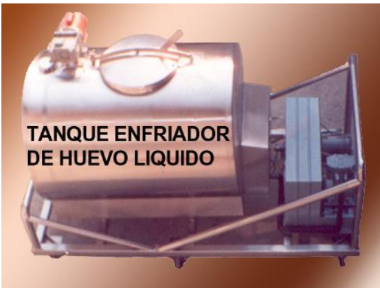
TANQUE ENFRIADOR DE HUEVO LIQUIDO