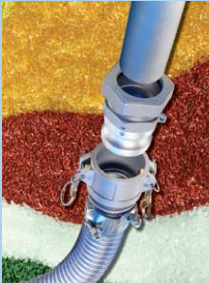
Conexiones rapidas de compresion en aluminio para sujetarse en tuberia de aluminio en sistemas neumaticos secos