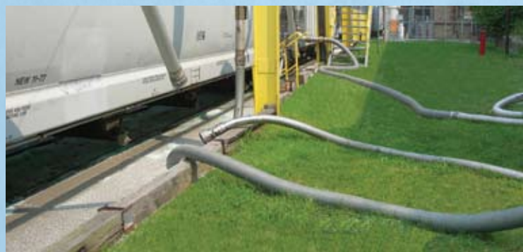
Manguera metalica para descarga de materiales a granel desde carros de ferrocarril