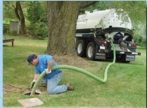
Manguera tigergreen para limpieza de fosas septicas