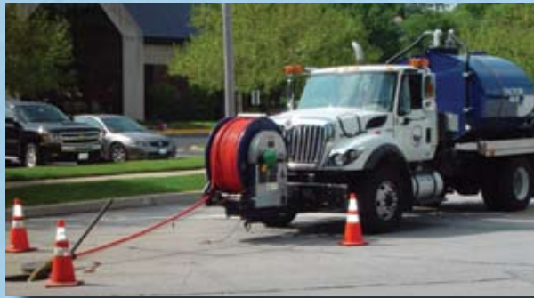
Manguera termoplastica de alta presion para limpieza de drenajes