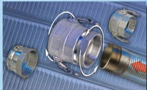
Ensamble de manguera metalica con conexiones npt para el manejo de materiales secos