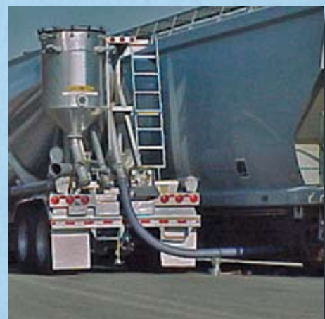
Manguera metalica para descarga de materiales a granel desde tolvas