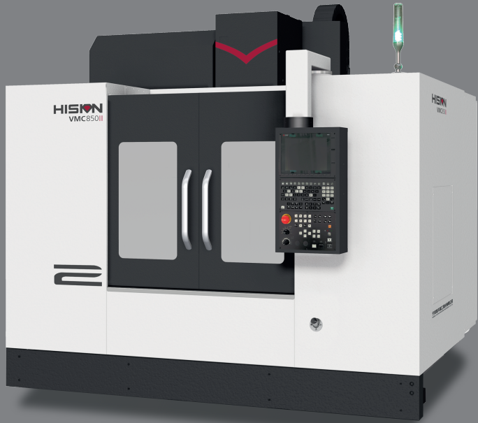
VMC 850II $1,606,514 pesos 760mm x 400 mm x 500 mm Peso de la Máquina: 6 ton 8,000 RPMV