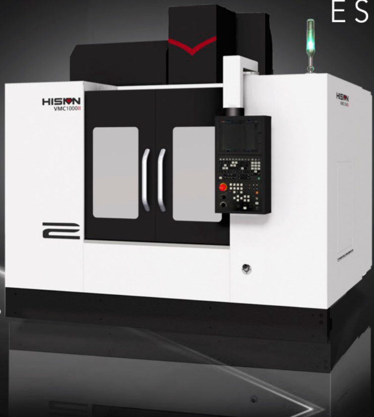
VMC1000II CENTRO DE MAQUINADO VERTICAL RECORRIDOS: 1000X600X500 RPM's: 8,000 PESO MÁQUINA: 8 Ton

SIN ENGANCHE Y 4 PAGOS EN LOS MESES 6,12,18 Y 24 DE $445,500 PESOS