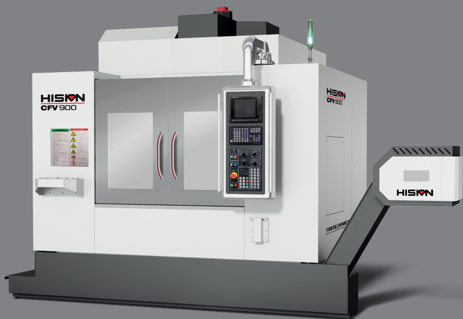
CFV 900 $2,319,278 pesos 900mm x 430mm x 510 mm Peso de la Máquina: 7 ton 12,000 RPM